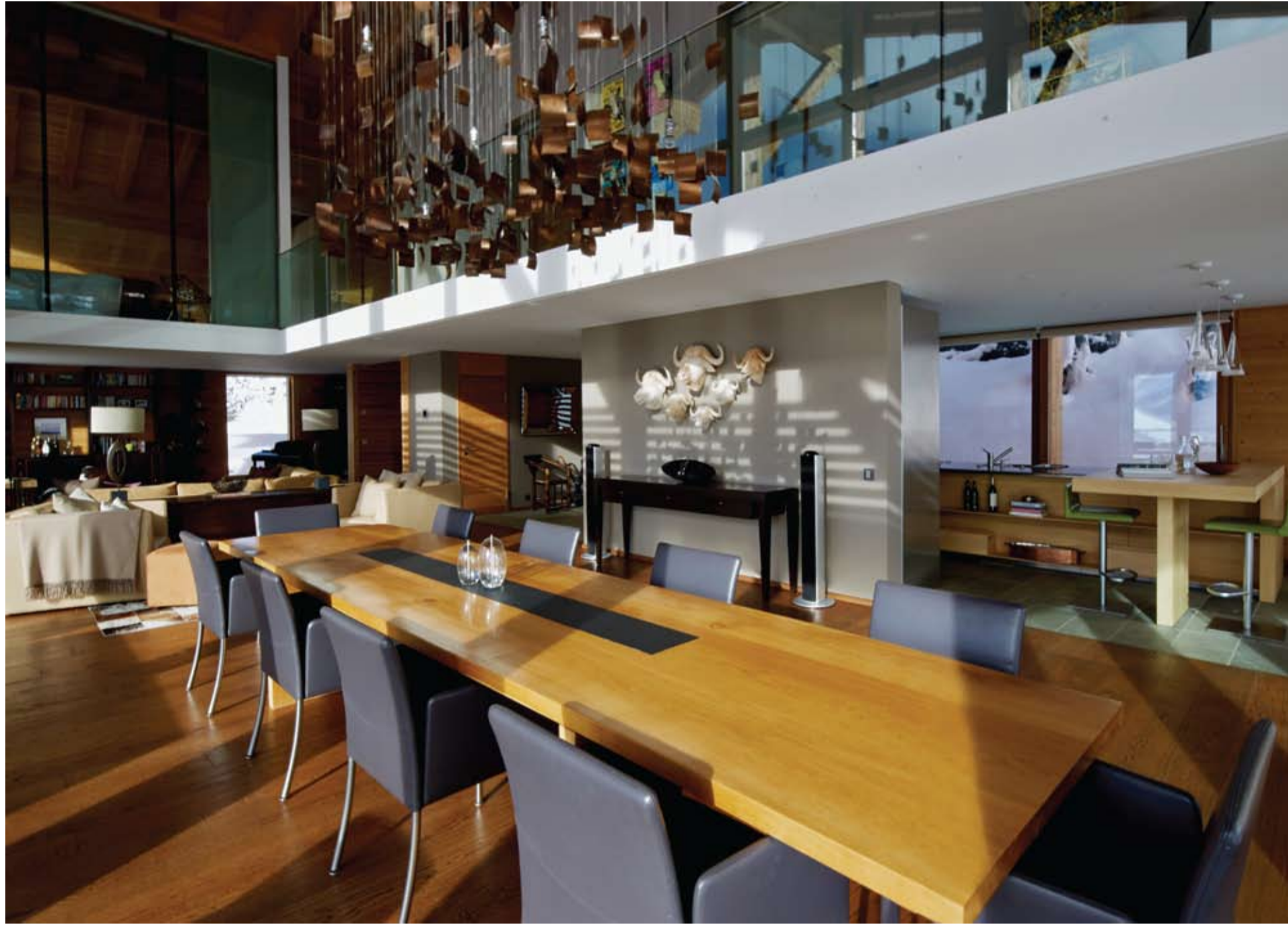
Mekanın en dikkat çekici yanlarından biri şüphesiz kullanılan aydınlatmalar. Yemek masasının üzerinde bulunan 100 adet eskitilmiş bakır plakadan oluşan 4 metre yüksekliğindeki avize, özellikle gün batımı ışığını duvarlara ve ana atriuma yansıtıyor.